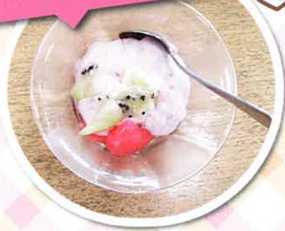
いちごフルーチェ