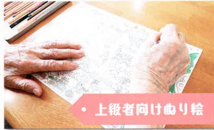
上級者向け曲り絵