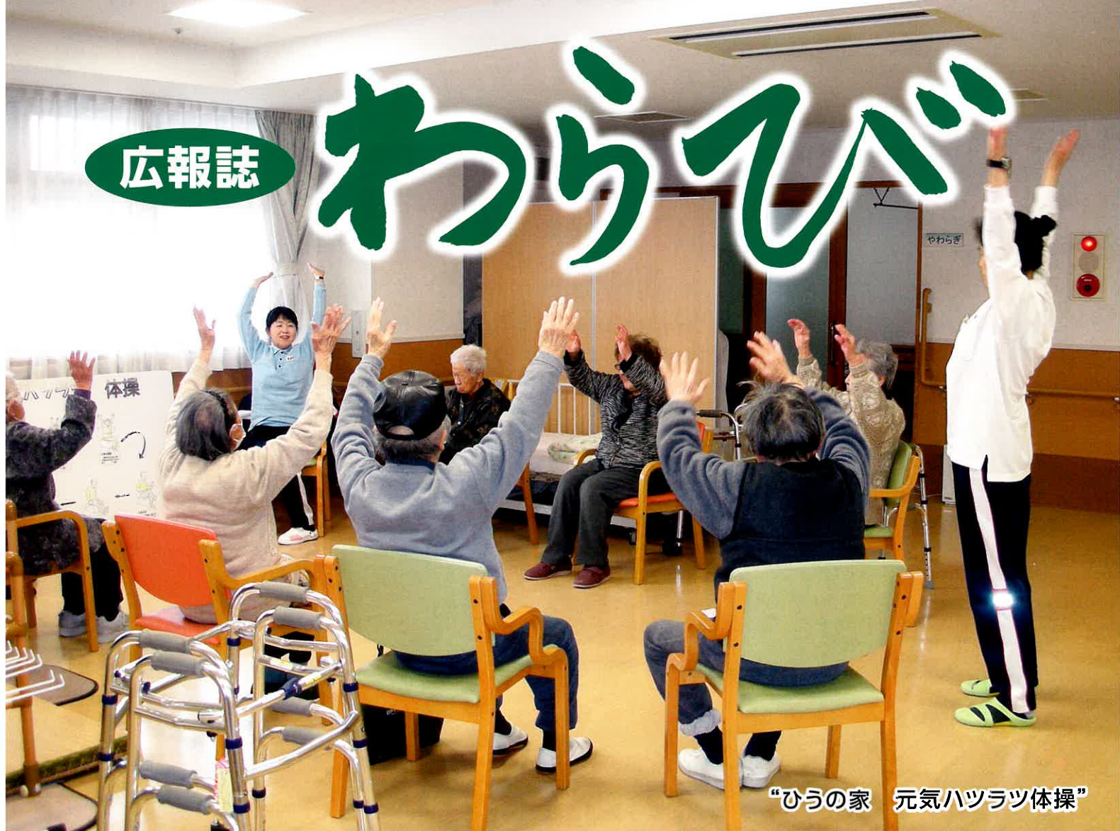
“ひうの家 元気ハツラツ体操”

発行／高齢者総合福祉施設わらび園／〒949-5406 長岡市浦3060番地 TEL 0258 (41) 3150(代) FAX0258 (41) 3152