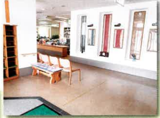
わらび園 玄関と廊下の 壁紙を張替え