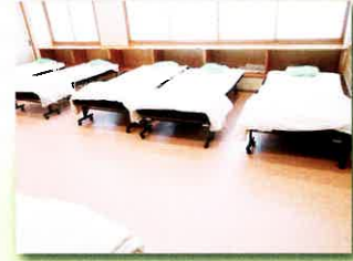
わらび園 畳部屋を フローリングへ