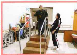
新聞玉入れゲーム！ 軽くて難しいよ～