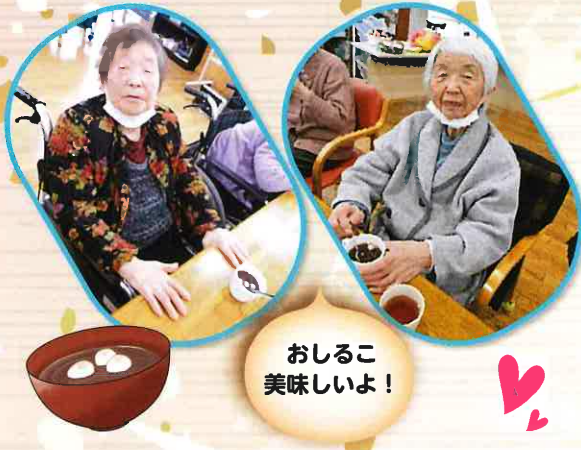
おしるこ 美味しいよ！