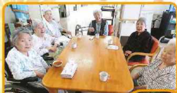
女子会の一コマです みんなで飲むお茶は格別。懐かしい 歌番組を観て昔話に花が咲きます。