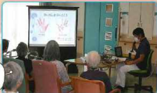
歯科医院の先生より感染症・口腔ケアについて講義と実技指導をしていただきました。皆さん真剣です。(R5.10)

今年もおぢやまつり名物からくり万灯が5町内より来所されました。お囃子に合わせて手拍子をしたり大変盛り上がりしました。(R5.8)