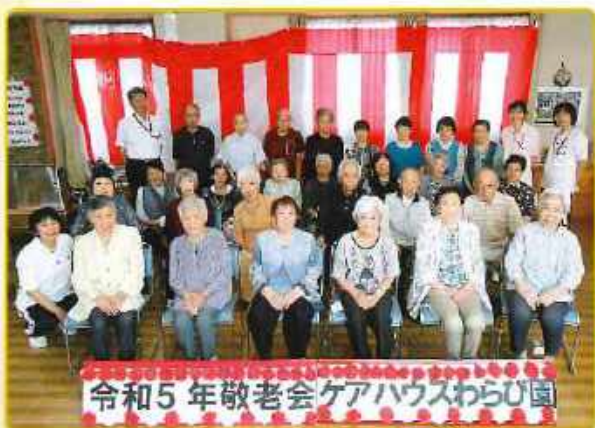
令和5年敬老会 ケアハウスわらび園

ケアハウス利用者は男性8名、女性22名、計30名の方がお元気で生活しています。平均年齢は86歳、最年長は98歳、最年少は64歳です。