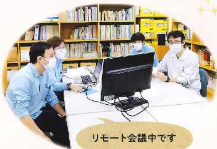
リモート会議中です

私たちは住み慣れた地域、 自宅で暮らし続けられるよう お手伝いさせていただきますので どうぞお気軽にご相談下さい。