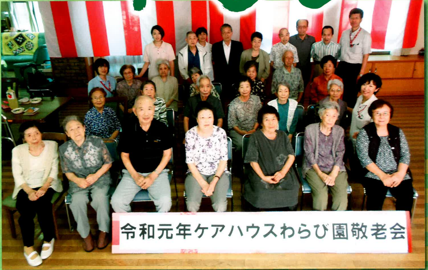
令和元年ケアハウスわらび園敬老会

発行/高齢者総合福祉施設わらび園/〒949-5406 長岡市浦3060番地 TEL 0258 (41) 3150(代) FAX0258 (41) 3152