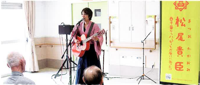
誕生会でシンガーソングライターの「松尾貴臣」さんのミニコンサートを行いました。プロの美声にうっとりです。(H30.9)