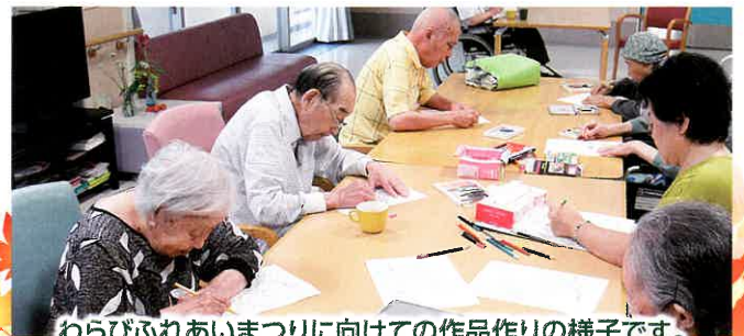
わらびふれあいまつりに向けての作品作りの様子です。素晴らしい作品が出来ます様に!(H30.10)