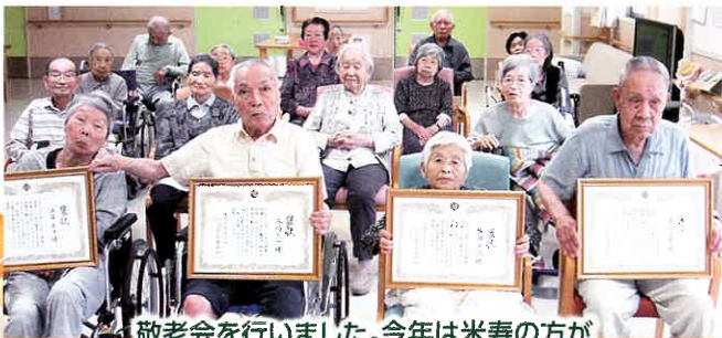
敬老会を行いました。今年は米寿の方が4名もおられました。いつまでもお元気で長生きして下さい。