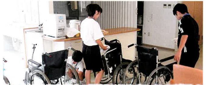
今年も片貝中学校1年生の福祉施設体験ボランティアが行われました。車椅子もピカピカです。(H30.9)