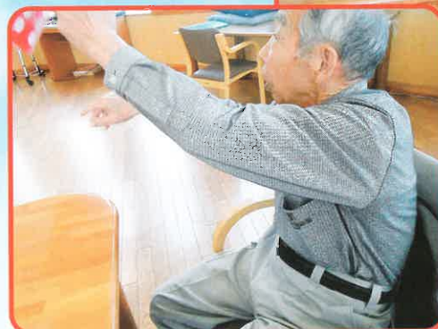
体操やレクリエーション活動の一部です。日々楽しんで体を動かしてもらいたいと思い、色々なゲームなど職員で考えて行っています。