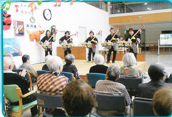
こぶしの会・・・私達とは違った盛り上がりを見せてくれました。とても楽しまれています。