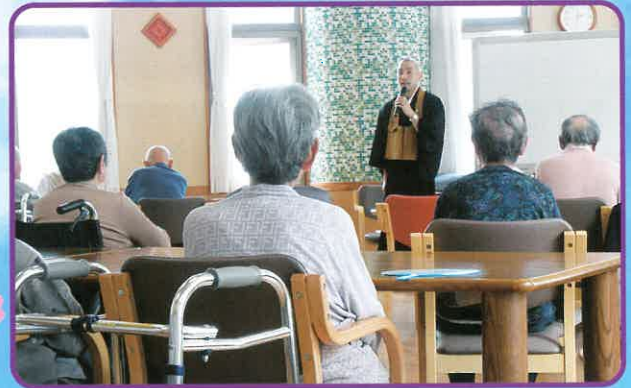
ビハーラ法話会・・・座禅の組み方や永平寺について話を聞きました。普段にも増して皆さん真剣な顔つきでした。