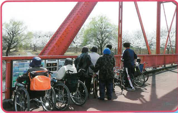
外出してきました。天気も良く、季節を感じてもらえたら嬉しいです。