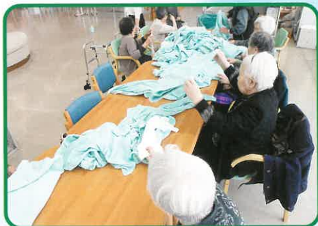
洗濯物たたみいつもありがとうございます。手を動かす事も運動の一環。お手伝い助かっています♪