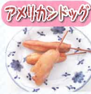
アメリカンドッグ