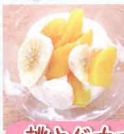
桃とバナナのフルーチェ