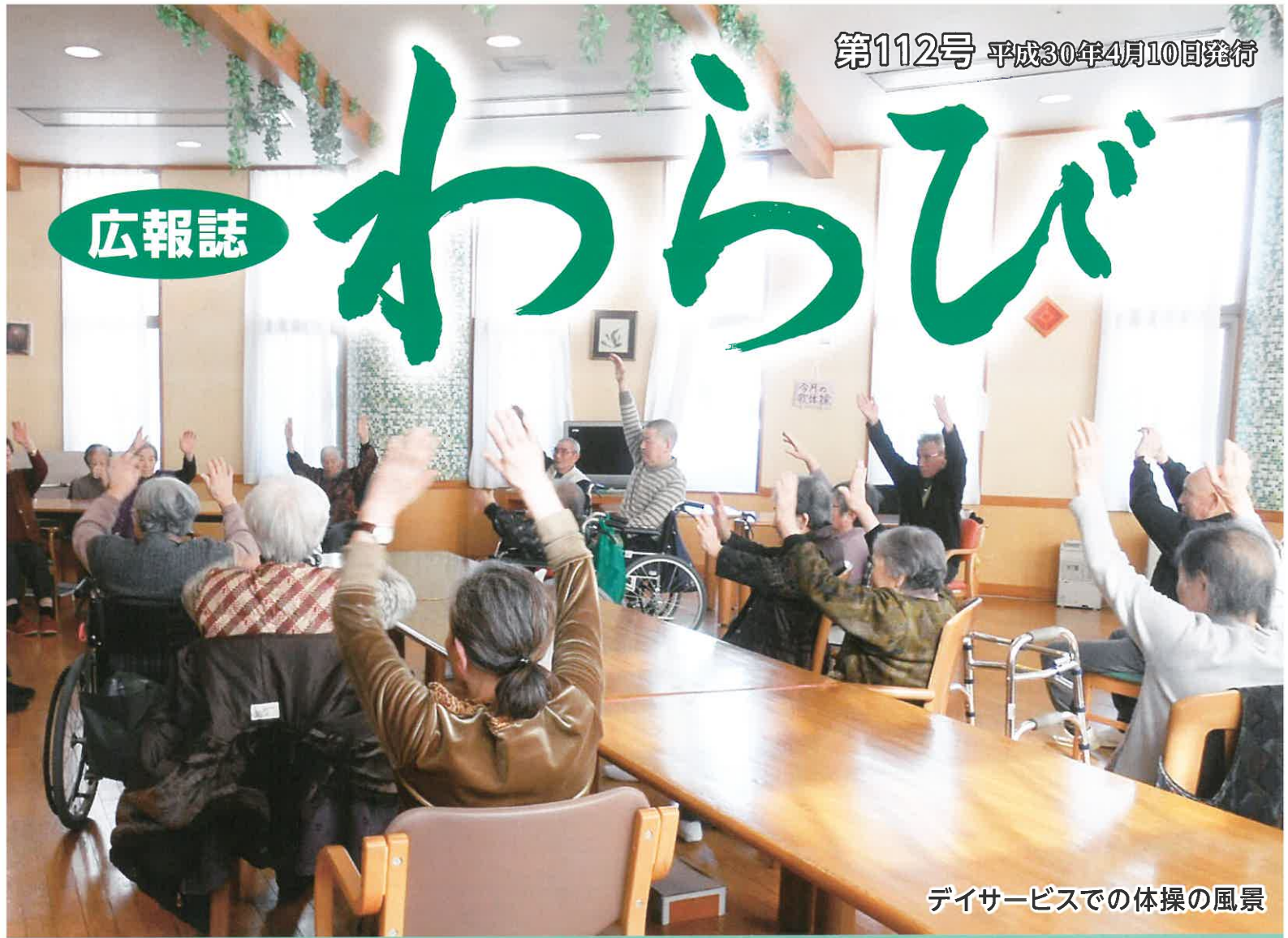
デイサービスでの体操の風景

発行/高齢者総合福祉施設わらび園/〒949-5406 長岡市浦3060番地 TEL 0258 (41) 3150(代) FAX0258 (41) 3152