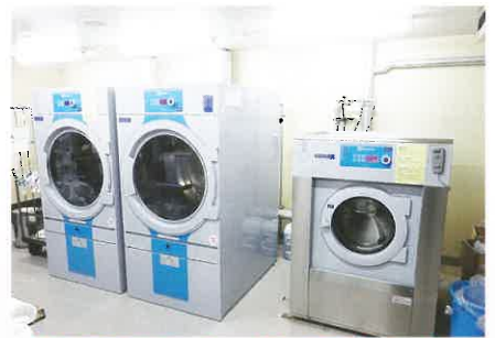
洗濯機1台 乾燥機2台