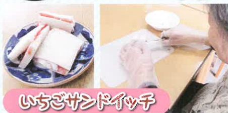
いちごサンドイッチ