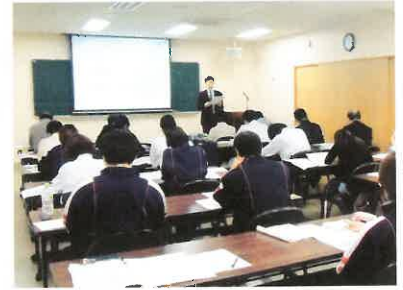
2015年版内部品質監査員養成研修の様子(2017.11月)