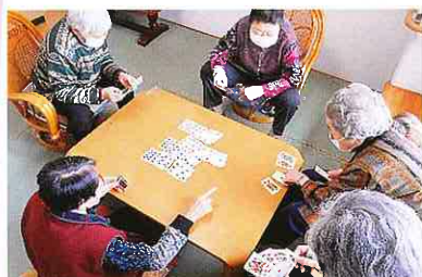
談話室でトランプしたり