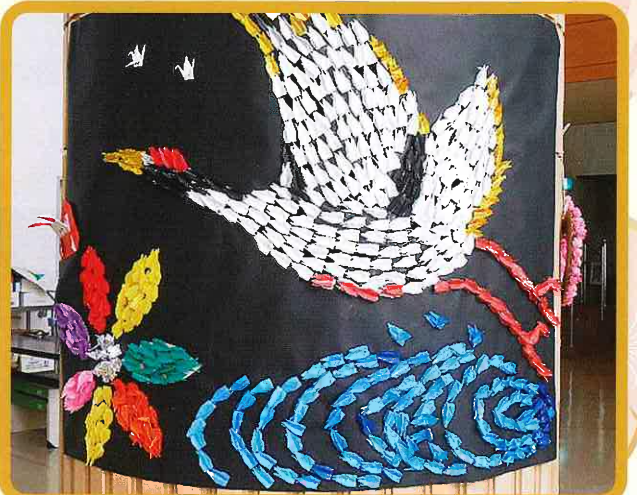
デイサービスこしじ利用者様の作品 全部折り鶴で作りました！