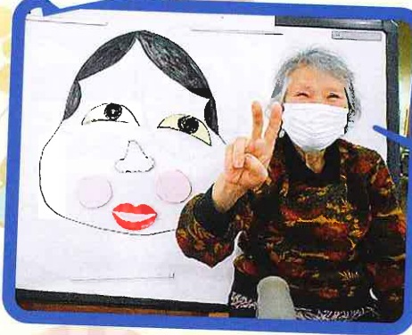
お楽しみ会での福笑い