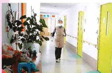
運動の為、廊下を歩いてま〜す