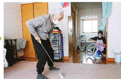
ヘルパーさんと一緒に自分の部屋を掃除