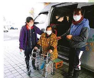
デイサービスに行ってきました!