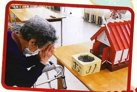
わらび大社にお参り、くじ引きを 引きました！大吉が出るかな？