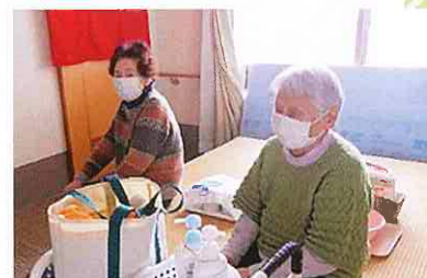
お風呂の順番待ちです