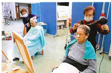
月に1回の床屋さんです