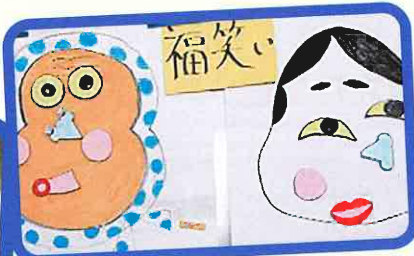
上手に できました！