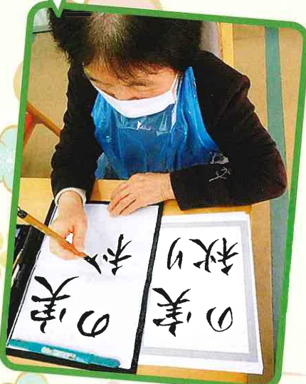
上手く書けたかな？